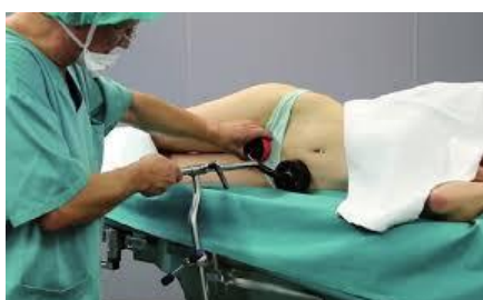
Positionierung am Patienten